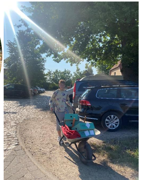
Daneben: Vorbereitung Hansestationen